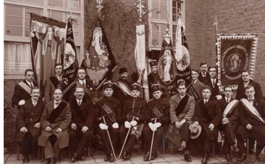
De vlaggen van de Sloveense St. Barbara verenigingen, ca. 1933.

Op de katholieke dag uitte men voor het eerst openlijk het verlangen naar een eigen vaste